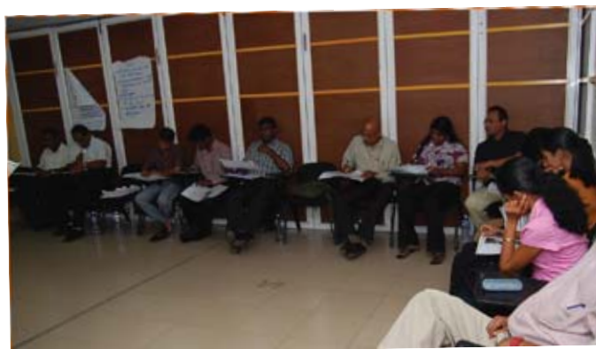
ශ්‍රී ලංකා ජනමාධ්‍ය විද්‍යාලයේ දී පැවති විශේෂාංග රචනය මැයෙන් වූ ජනමාධ්‍යවේදීන් සඳහා වූ පුහුණු වැඩමුළුවේදී විශේෂාංග කර්තව්‍යවරුන්ගේ සහ විශේෂාංග ලේඛකයින්ගේ හමුව. (2010 අගෝස්තු 13)