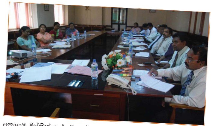
කොළඹ දිස්ත්‍රික් ලේකම් කාර්යාලයේ පැවති කොළඹ දිස්ත්‍රික් ප්‍රාදේශීය ලේකම්වරුන්ගේ සහ දිස්ත්‍රික් සහකාර ලේකම්වරුන්ගේ හමුව. (2010 ජූනි 11)