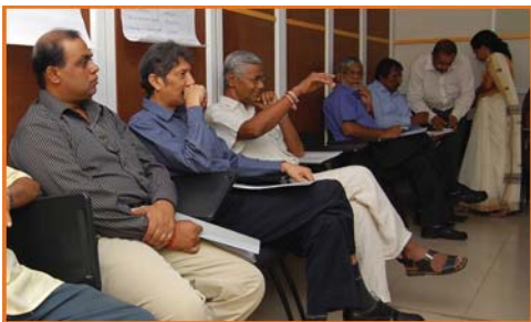
වාර්ෂික මහ සභා රැස්වීමට සහභාගි වූ සාමාජිකයන් ගෙන් පිරිසක්.