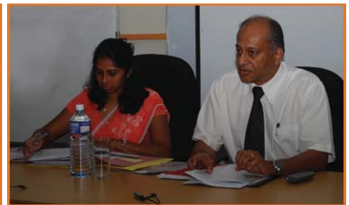
ශ්‍රී ලංකා පුවත්පත් පැමිණිලි කොමිසමේ සභාපති කුමාර් නඬේසන් මහතා අදහස් දක්වන අයුරු.