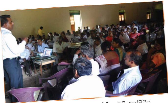
ඇල්පිටිය ආනන්ද මධ්‍ය මහා විද්‍යාලයේ දී පැවති ඇල්පිටිය කලාප අධ්‍යාපන අධ්‍යක්ෂවරු සහ විදුහල්පත්වරුන්ගේ හමුව. (2010 මැයි 04)